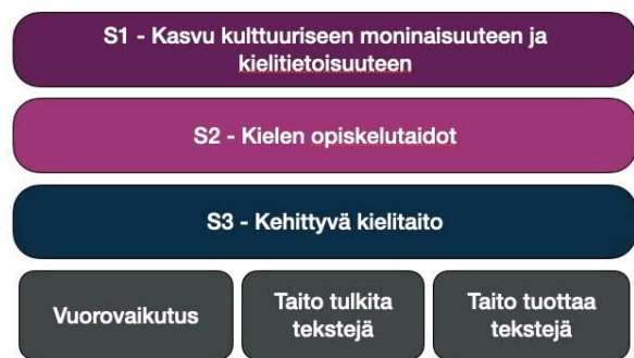
Kuva 1. Opetussuunnitelman tavoitteisiin liittyvät sisältöalueet

Liedon kunnan kieliohjelman mukaan kielten opiskelu alkaa ensimmäisellä vuosiluokalla A1-kielenä. Ensimmäinen vieras kieli on kaikilla oppilailla englanti. A1 -kielen opetuksen tavoitteet määritellään kunnan opetussuunnitelmassa, joka on laadittu valtakunnallisten opetussuunnitelman perusteiden pohjalta. Varhennetussa kielten oppimisessa (1. – 2. lk) pääpaino on vieraalle kielelle altistamisessa ja kielitietoisuuden lisäämisessä. Oppimisessa korostuvat toiminnalliset ja tutkivat työtavat, joissa oppilailta ei odoteta kirjoitus- tai lukutaitoa. Opetussuunnitelmassa mainitut tavoitteiden sisältöalueet taito tulkita ja tuottaa tekstejä nähdään tässä yhteydessä enemmän suullisena taitona (kuva 1.). Kieltä opitaan esimerkiksi leikkien, pelien ja laulujen kautta oppimisen painopisteen ollessa kielen ymmärtämisessä, suullisessa tuottamisessa ja kielellisessä vuorovaikutuksessa. Oppilaita kannustetaan käyttämään rohkeasti vierasta kieltä arjen tilanteissa. Kaikki oppiminen on tärkeää.