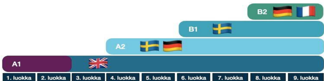
Kuva 2. Liedon kunnan kielipolku, kielten valinnat

Varhennetussa kielenopetuksessa pyritään hyödyntämään joustavia oppimisympäristöjä. Fyysisesti opetus voidaan järjestää hyödyntäen kaikkia koulun tiloja sekä mahdollisuuksien mukaan koulun lähiympäristöjä. Opetustuokioiden pituutta voidaan vaihdella ja ne voidaan integroida muuhun opetukseen taikka pitää muun opetuksen lomassa joustavin menetelmin.