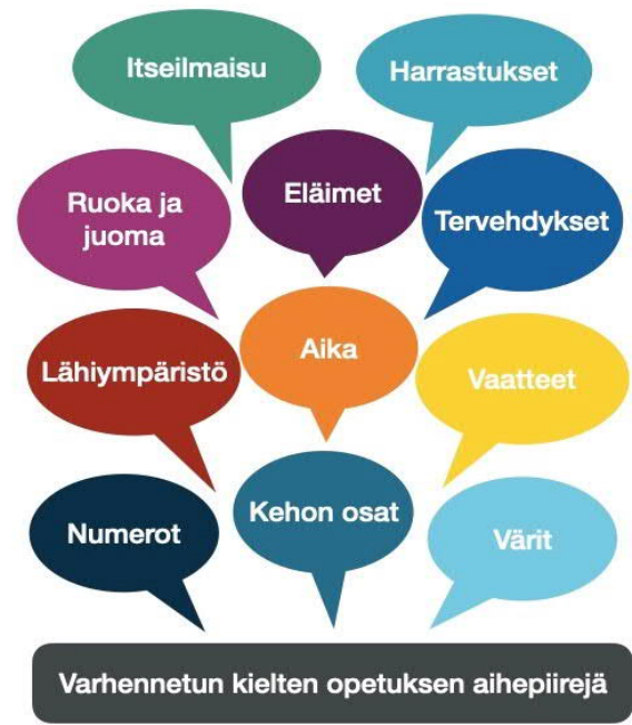
Kuva 3. Varhennetun kielen opetuksen aihepiirejä

Varhennetun kielen arviointi on luonteeltaan formatiivista, positiivista ja oppilasta kannustavaa. Arvioinnissa käytetään myös itse- ja vertaisarviointia.